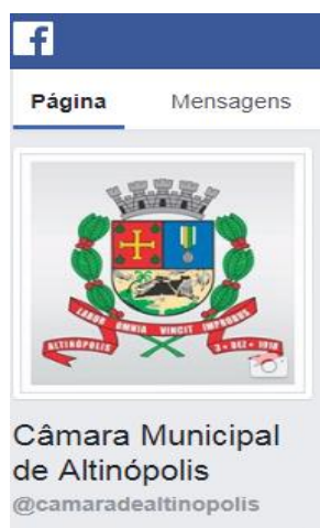
Figura 2 Página no Facebook da Câmara de Altinópolis

Rede Social: disponibilizado um canal na rede social Facebook, através de uma fan Page, denominada “camaradealtinopolis”, onde são divulgadas as ações do Poder Legislativo.