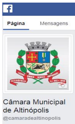
Figura 2 Página no Facebook da Câmara de Altinópolis

Rede Social: disponibilizado um canal na rede social Facebook, através de uma fan Page, denominada “camaradealtinopolis”, onde são divulgadas as ações do Poder Legislativo.