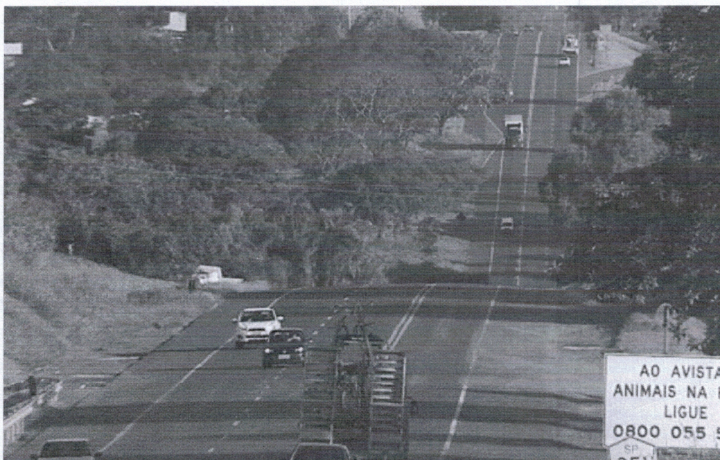
Rodovia Altino Arantes, no município de Batatais

Postado em: 28/01/2016 às 13:00 em Trânsito