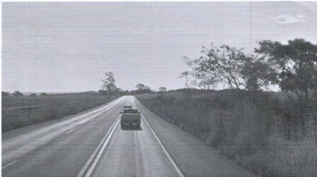
Trecho do km 35, onde haverá novo pedágio em Batatais