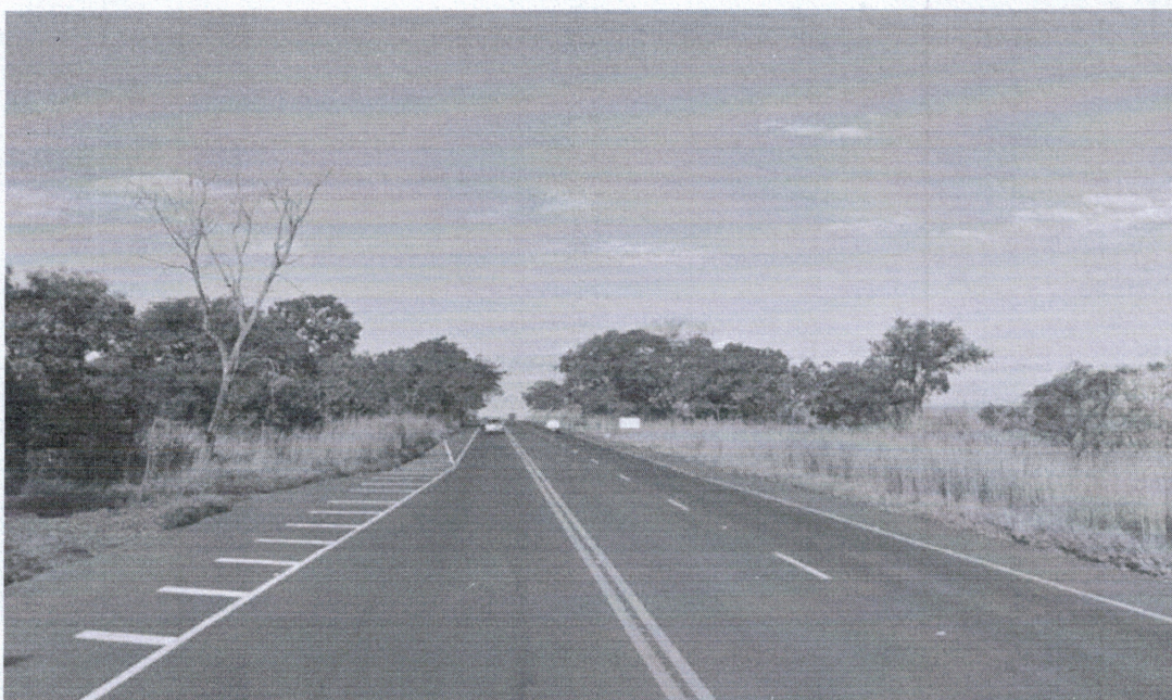
Km 35 da Altino Arantes, onde haverá pedágio