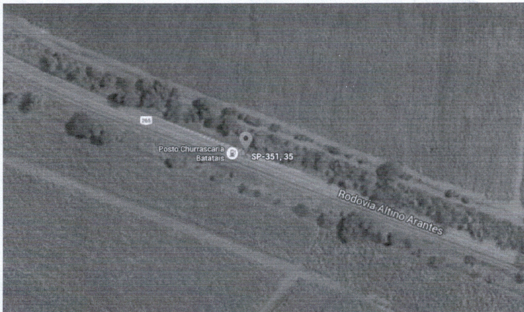
Trecho onde a praça de pedágio será construída